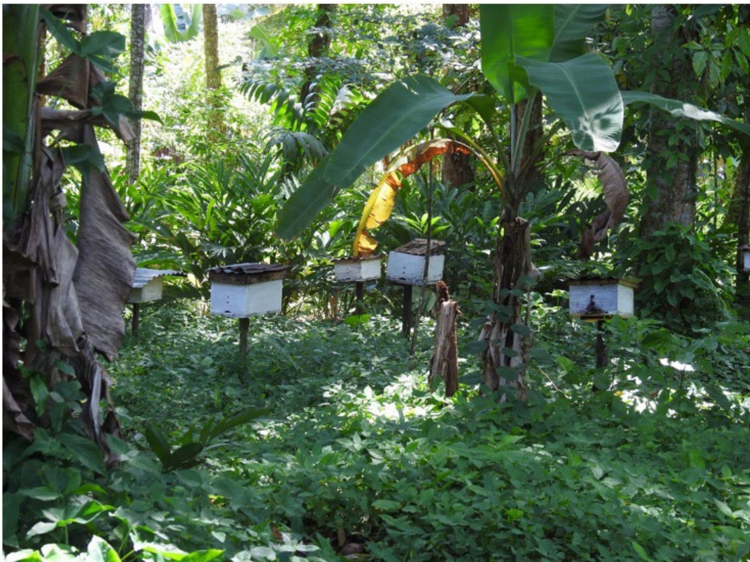
Gambar 1. Lingkungan peternakan kelulut Kelompok Tani Sakato Palak Juha (atas) dan kotak sarang yang dihuni oleh koloni kelulut (bawah)