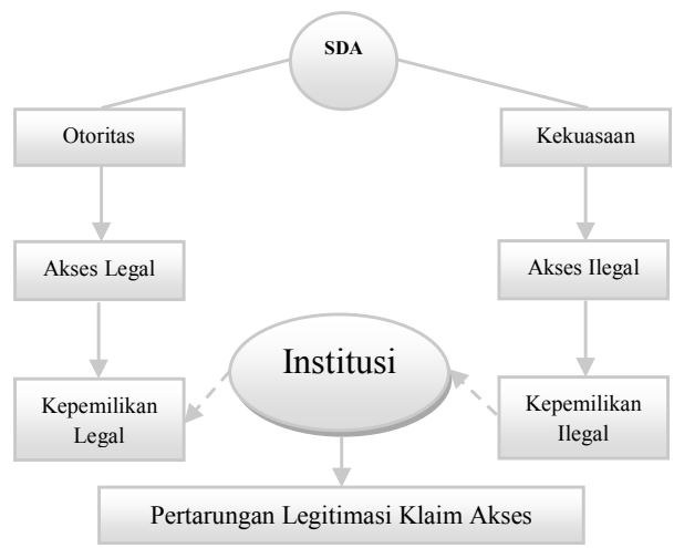
Gambar 3. Teori Akses Sikor dan Lund (2009)

Pola penguasaan ini didasarkan pada sistem kepercayaan adat masyarakat setempat dimana lahan yang dikuasi diperoleh secara turun-temurun dari leluhur mereka. Sistem penguasaan dan pewarisan lahan masyarakat Bathin Sembilan berbentuk kepemilikan kolektif/ ulayat. Di dalam teritori ulayatnya, keluarga-keluarga menetapkan haknya dengan melakukan pertanian dan kepemilikan tanah yang diwarisi secara setara kepada laki-laki dan perempuan. Lokasi desa yang sering berpindah-pindah di dalam wilayah ulayat, diingat melalui lokasi kuburan tua yang masih dapat ditemukan dalam hutan. Namun saat ini, kolektifitas masyarakat yang didasarkan pada identitas adat telah semakin memudar. Hal tersebut terjadi akibat percampuran etnis, dimana percampuran tersebut utamanya terjadi karena hubungan pernikahan. Batas-batas kepemilikan melalui sistem adat ini ditandai dengan tanaman penanda tertentu seperti pohon durian, pohon jernang, dll.