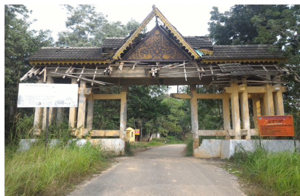
Gambar 2. Pintu Masuk THR STS

“Jauh panggang dari api” adalah istilah yang paling tepat untuk menggambarkan kondisi THR STS saat ini. Bentuk ideal yang diharapkan dalam pengelolaan THR STS nyatanya jauh berbeda dengan kondisi rill di lapangan. Contohnya saja dalam penataan kawasan dengan skema pembagian menjadi tiga blok pemanfaatan, pada kenyataannya tidak teraplikasi sama sekali di lapangan. Berdasarkan hasil observasi langsung, di sepanjang kawasan THR STS hanya terlihat bentangan perkebunan sawit dan karet yang sangat dominan. Lemahnya kontrol atas hutan ini salah satunya dikarenakan masih sangat minimnya sarana dan prasarana yang ada di dalam kawasan THR STS, terutama yang dimiliki oleh Unit Pelaksana Teknis Daerah (UPTD) sebagai ujung tombak penjaga kawasan THR STS.