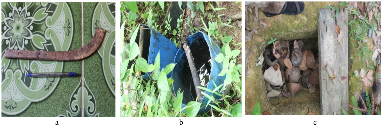
Gambar 1 c. Alat sadap; b Galon plastik wadah penampung getah; c Lubang tanah pengolahan getah

Penyadapan getah dilakukan pada ketinggian 1,5 m dari tanah, kemudian disadap arah ke atas dan ke bawah seperti huruf V. Getah terbanyak adalah pada ketinggian sadapan 4m dari tanah. Dalam satu batang besar menghasilkan 5-10 kg. Apabila batang kecil 10-20 batang menghasilkan 10 kg getah dalam sehari. Maksimal 20 pohon sadap menghasilkan getah 35 liter. Pohon jelutung lebar 1,5 m menghasilkan getah 5 kg. Menyadap 30 batang menghasilkan getah jelutung 60 kg. Banyak cabang dan jumlah daun jelutung mempengaruhi produksi getah. Jelutung yang rimbun daunnya lebih banyak getahnya.