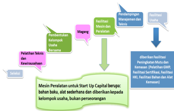
Gambar 1. Program Pengembangan WUB Melalui Pola Fast Track

Berdasar pengukuran efektivitas dan dampak program pada tahun 2020 (IKMA, 2020), masih terhadap beberapa kekurangan dan membutuhkan penyempurnaan program di masa mendatang. Penelitian dilaksanakan untuk menyusun rekomendasi pengembangan Program Wirausaha Baru yang telah dilaksanakan, namun belum memberikan dampak yang maksimal.