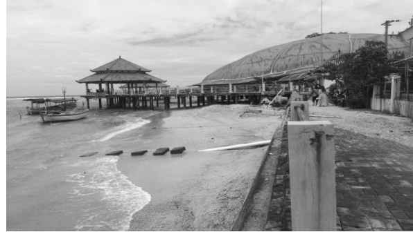
Gambar 4. Lokasi 3 di Pantai Kartini.