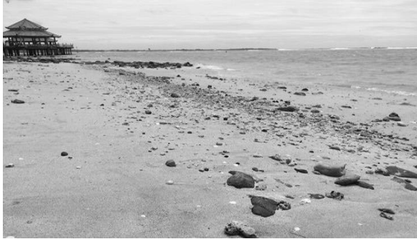
Gambar 3. Lokasi 2 di Pantai Kartini.