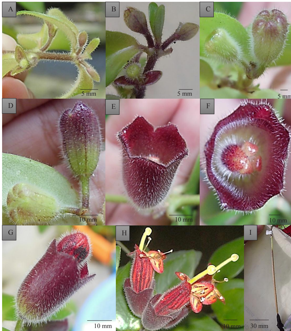
Gambar 2. Pola perkembangan bunga lipstick 'Soeka', A. Kuncup reproduktif pada ketiak daun utama (2-11 minggu setelah aplikasi ZPT), B. Kuncup daun berkembang, berubah warna menjadi merah, dan di dalamnya terdapat kenop (kelopak bunga), C & D. Daun luruh, kelopak bunga bertangkai, e. Kenop membesar, membuka (seperti lonceng) dan berwarna merah gelap, mengkilat, dan berbulu, F. Bakal bunga di dalam kelopak bunga yang berbentuk seperti lonceng (muncul 2-3 minggu setelah kuncup reproduktif muncul), G. Bakal bunga memanjang seperti lipstick (muncul 2-3 minggu setelah kuncup reproduktif muncul), H. bunga mekar (1 minggu setelah memanjang seperti lipstick), I. buah (1 minggu setelah bunga mekar)

dibandingkan dengan dua ZPT lainnya yang diujikan untuk menginisiasi pembungaan bunga lipstick 'Soeka'.