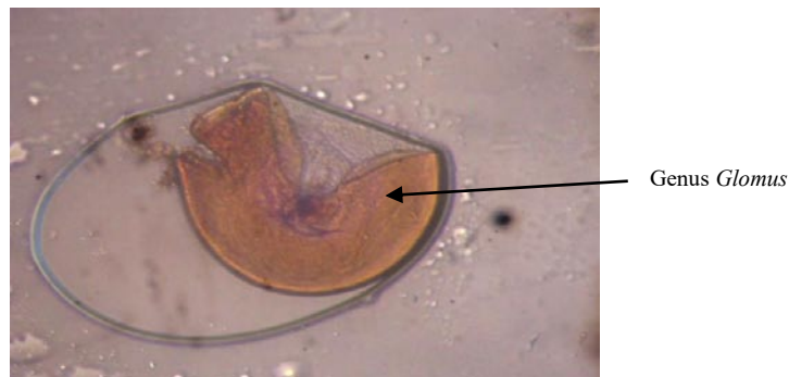
Gambar 3. Hasil pengamatan genus Glomus di lahan bekas tambang emas