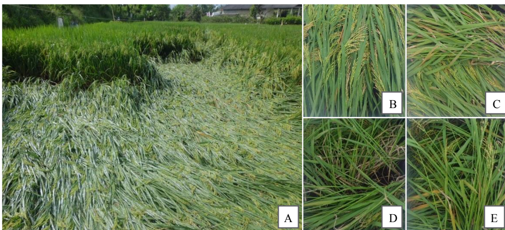
Gambar 1. Tanaman padi rebah akibat terpaan cuaca ekstrim (A), membentuk berbagai macam formasi: formasi rebah lurus (B), formasi rebah berbelok (C), formasi rebah berputar (D), dan formasi rebah berlawanan arah (E). Gambar B, C, D, dan E diambil menghadap ke arah Utara pada ketinggian 125 cm menggunakan kamera poket Casio Exilim

DR yang semakin tinggi juga nyata menurunkan bobot kering jerami, batang, dan daun. Sebagai contoh, bobot kering jerami per batang pada DR0 sebesar 7.63 \pm 0.32 \text{ g} sedangkan pada DR4 sebesar 6.51 \pm 0.26 \text{ g} ; bobot kering batang pada DR0 sebesar 3.62 \pm 0.18 \text{ g} sedangkan pada DR4 sebesar 2.99 \pm 0.03 \text{ g} , demikian juga pada bobot kering daun (Tabel 3). Penurunan berat kering pada jerami, batang dan daun menunjukkan adanya perubahan mobilisasi fotosintat. Kemampuan mobilisasi asimilat pada organ vegetatif menjadi hal yang sangat penting dalam merakit tanaman padi tahan cuaca ekstrim. Tentu saja karakter batang padi yang kuat sebagai karakter ketahanan terhadap rebah (Ookawa et al. , 2010) masih tetap relevan. Terkait hal tersebut, Zhang et al. (2014b) telah memberi catatan pentingnya dalam aplikasi pupuk khususnya nitrogen untuk memperbaiki karakteristik batang tanaman padi.