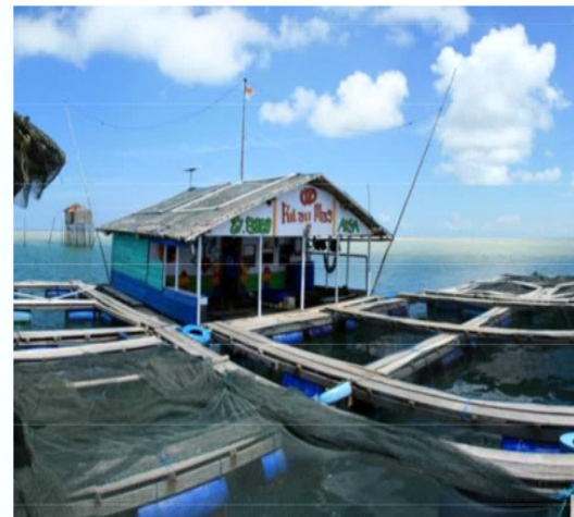
Gambar 2. Ilustrasi keramba jaring apung