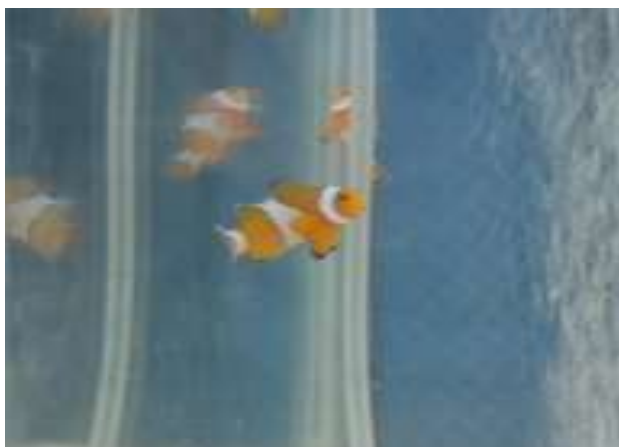
Gambar 1. Anemon ( Heteractis magnifica )

Klasifikasi Amphiprion ocellaris (Masuda et al , 1984) adalah sebagai berikut :