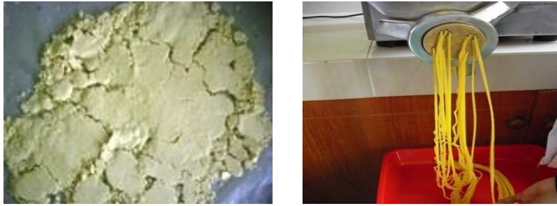
Gambar 3. (a) Adonan sebelum dikukus, (b) Proses pencetakan mi basah jagung

Pada penelitian ini digunakan ekstruder pencetak, dimana adonan tepung jagung telah dikukus sehingga tidak mudah mengalir karena berbentuk gumpalan yang kohesif dan agak lengket, sehingga ruang antara ulir dan laras ( barrel ) tidak selalu dalam keadaan penuh. Kondisi tersebut menyebabkan tingkat kompresi yang kurang. Tingkat kompresi pada adonan akan menentukan struktur, kepadatan, daya ikat antar partikel bahan dan tekstur produk termasuk elongasi.