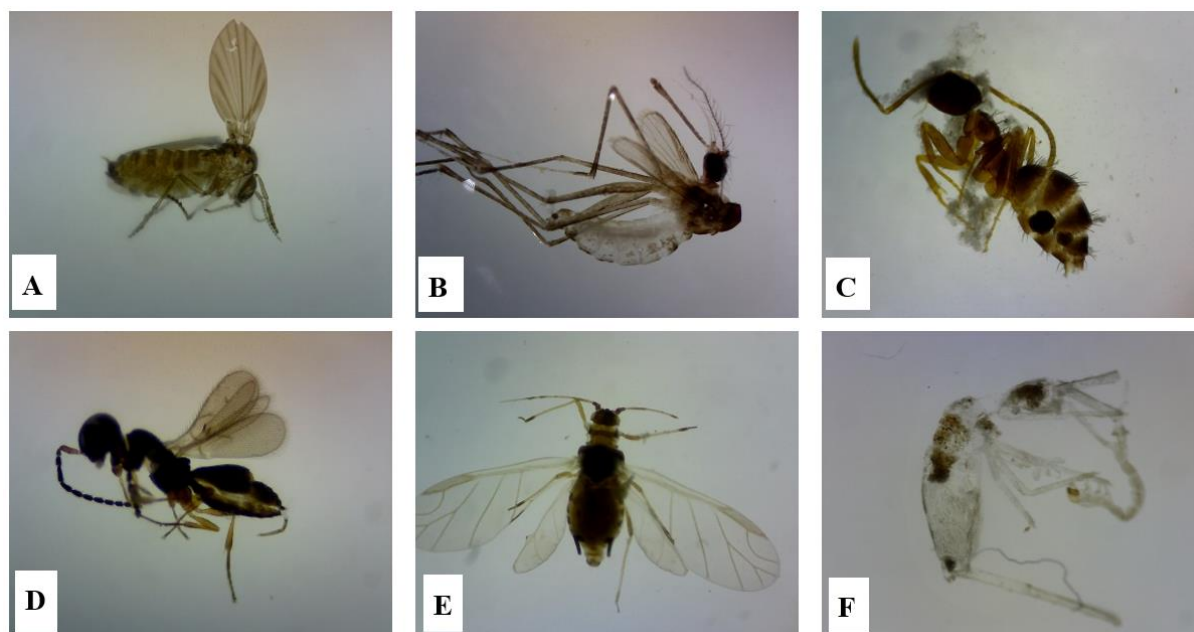
Gambar 3 Serangga yang terperangkap dengan metode yellow-pan trap : (A) Psychodidae (Diptera) 25x; (B) Culicidae (Diptera) 20x; (C) Fomicidae 15 25x; (D) Mymaridae 2 (Hymenoptera) 25x; (E) Aphididae (Hemiptera) 6,7x; (F) Collembola 25x

Ordo Hymenoptera yang paling banyak ditemukan kedua di setiap umur tegakan R. mucronata yaitu famili dari Formicidae (Gambar 3C) dan Mymaridae (Gambar 3D). Formicidae memiliki komposisi 286 individu dan 20 morfospesies. Sedangkan Mymaridae memiliki komposisi 80 individu dan 15 morfospesies. Famili formicidae atau semut-semutan menurut Ayu (2018) merupakan serangga dalam famili Formicidae yang memiliki kelimpahan terbesar dan telah ditemukan dari 15.000 jenis semut di dunia. Formicidae yang banyak ditemukan di lokasi penelitian yaitu dari genus Monomorium . Banyaknya jenis Monomorium mengindikasikan bahwa di daerah tersebut terdapat banyak serasah karena menurut Adonovan et al. (2016) menyatakan semut dari genus Monomorium