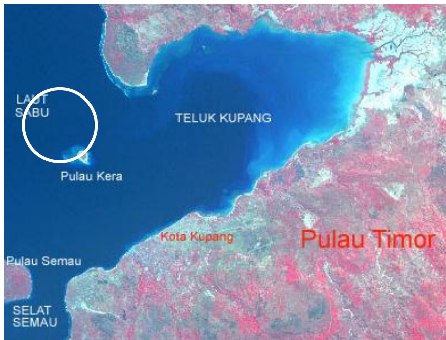
Gambar 1. Lokasi Penelitian (Pulau Kera dalam Kawasan Teluk Kupang) ( http://www.kimpraswil.go.id/infopeta/citra/spotxsindex.htm )

Metode penelitian yang digunakan adalah metode deskriptif eksplorasi dan Kausal. Metode deskripsi eksplorasi digunakan untuk menentukan kelas kesesuaian dan memprakirakan daya dukung wilayah pesisir untuk kegiatan pariwisata, sedangkan metode deskriptif digunakan untuk mengkaji berbagai kemungkinan pengembangan dan dampak kegiatan pariwisata di wilayah pesisir Pulau Kera. Penetapan menggunakan metode eksplorasi berdasarkan pertimbangan bahwa penelusuran kondisi wilayah pesisir untuk kegiatan pariwisata membutuhkan kajian mendalam berdasarkan kriteria yang telah ditetapkan.