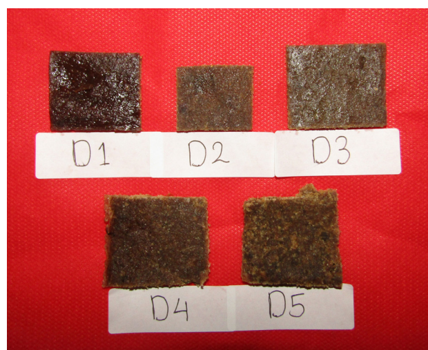
Figure 2 Minced tuna ( E. affinis ) jerky with seaweed addition E. Cottonii . D1 = with seaweed addition 0% (control); D2 = with seaweed addition 2,5%; D3 = with seaweed addition 5%; D4 = with seaweed addition 7,5%; D5 = with seaweed addition 10%.

Kenampakan adalah penilaian yang berhubungan dengan penampilan suatu produk yang dapat dilihat secara visual dengan indera penglihatan yaitu mata. Kenampakan yang menarik dapat mempengaruhi ketertarikan seseorang untuk mencoba dan merasakannya. Berdasarkan hasil organoleptik pada Figure 3 untuk parameter kenampakan memiliki nilai rata-rata 6,73-7,60 (agak suka sampai sangat suka) dengan nilai rata-rata tertinggi pada penambahan konsentrasi tepung E. cottonii 2,5% yaitu 7,60,