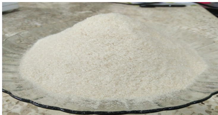
Figure 1 Seaweed flour E. cottonii .

Viskositas tepung E. cottonii memiliki nilai 107,02±0,51 cPs. Hasil ini lebih rendah dibandingkan hasil penelitian Chaidir (2006) yaitu 4970,40 cPs. Nilai viskositas yang berbeda kemungkinan dipengaruhi oleh kadar air pada rumput laut dan suhu ekstraksi.