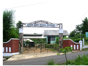
Gambar 1. Gapura Kamaro

Luas areal tapak kebun yang direncanakan adalah 5,9 Ha dan berada di daerah perbukitan dengan topografi berlereng dan pemandangan alam ( view ) cukup bagus. Status tanah milik Pemerintah Kabupaten Bogor yang peruntukannya semula ditujukan sebagai lahan kuburan. Secara administrasi batas-batas tapak kebun yaitu sebelah utara dibatasi oleh peternakan ayam dan kebun milik warga setempat, sebelah selatan oleh sebagian lahan kuburan milik desa dan kebun milik warga, sebelah barat oleh jalan desa dan sebelah timur oleh kebun milik warga. Gambar 3 menjelaskan view yang dapat dijadikan potensi wisata.