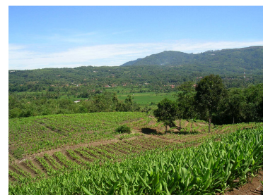
Gambar 3. Potensi View

Kondisi iklim pada tapak adalah suhu udara rata-rata 27,5°C/tahun, dengan suhu maksimum 33,2°C pada bulan Juli-Agustus dan suhu minimum 21,7 °C pada bulan Februari. Rata-rata curah hujannya adalah 4043 mm/tahun, sedangkan kelembaban nisbi adalah 84,1 %.