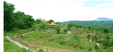
Gambar 2. Zona Produksi