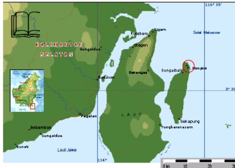
Gambar 1. Peta Lokasi Penelitian (Lingkaran Merah)

latan berbatasan dengan Desa Rampa dan Sungai Bali; Sebelah Timur berbatasan dengan Selat Makasar; dan Sebelah Barat berbatasan dengan Selat Sebuku.