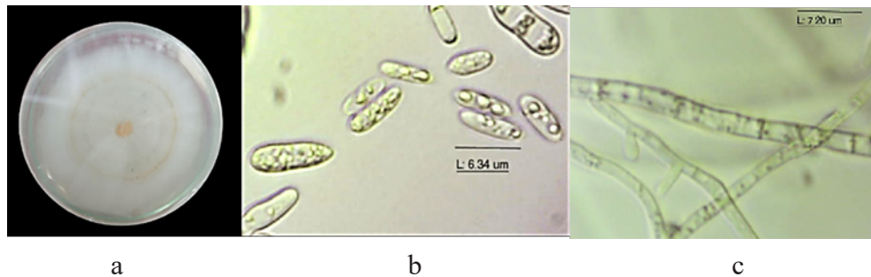
Gambar 1 Isolat Colletotrichum acutatum asal cabai. a. Biakan murni; b. konidium; dan c. miselium.

(Figure 1 Colletotrichum acutatum chili pepper isolates. a. Pure culture; b. conidium; and c. miselium).