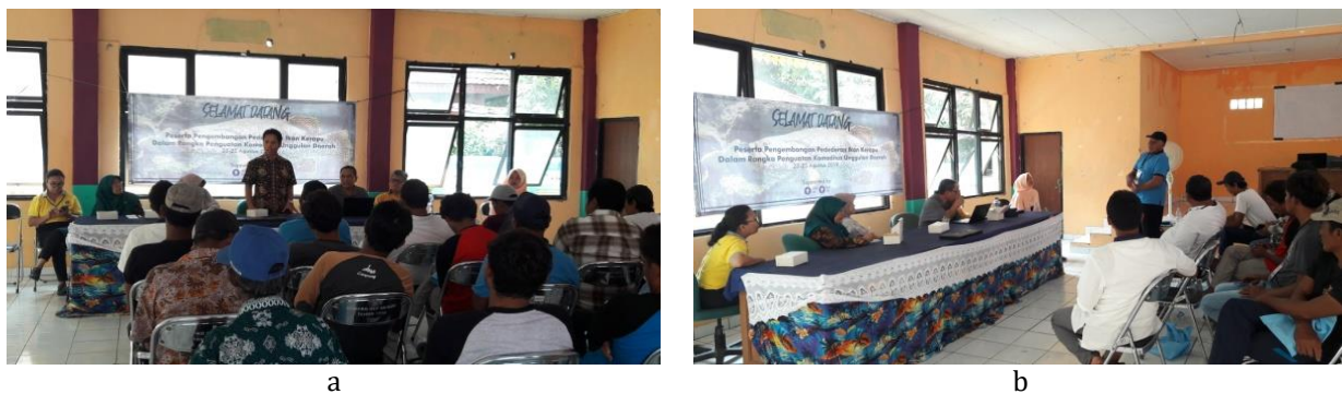
Gambar 3 Suasana pelatihan pengembangan pendederan ikan kerapu di masyarakat dalam rangka penguatan komoditas unggulan Kabupaten Administratif Kepulauan Seribu: a) sambutan Bapak Lurah Kelurahan Pulau Panggang, b) Harapan dari peserta yang disampaikan oleh Ketua Kelompok Sea Farming Pulau Panggang.

Kepulauan Seribu (hari I), penyampaian materi berupa ceramah, diskusi, dan demonstrasi cara (hari II), dan evaluasi pelatihan (hari III) (Tabel 1). Materi pelatihan yang diberikan sesuai dengan rencana yang telah disusun, namun urutannya mengalami perubahan. Pada hari II dan III pelatihan dilakukan masing-masing pre-test dan post-test untuk menguji keberhasilan pelatihan. Berdasarkan hasil pre-test dan post-