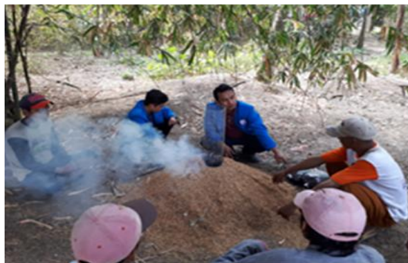
Gambar 3 Proses pembakaran sekam.

Masyarakat terlihat antusias memerhatikan paparan penyuluh mengenai alat yang dibutuhkan serta cara pembuatan arang sekam. Selama pelatihan berlangsung, beberapa orang peserta pelatihan secara aktif mengajukan pertanyaan terkait proses pembuatan arang sekam. Para peserta juga berkesempatan untuk mempraktikkan secara langsung bagaimana cara membuat alat pembakaran sederhana dari kaleng bekas atau kawat yang dibuat seperti tabung dengan tambahan minyak tanah, kertas,