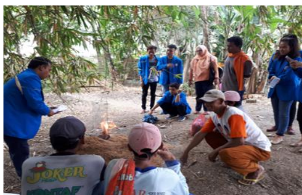
Gambar 4 Pemaparan teori mengenai arang sekam.

serta korek api. Pemberian kesempatan praktik secara langsung kepada masyarakat diharapkan di kemudian hari masyarakat Desa Sukamaju dapat melakukan proses pembuatan arang sekam ini secara mandiri.