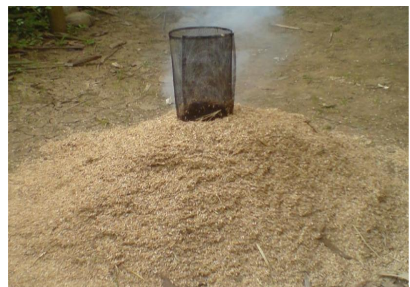
Gambar 2 Alat Pembakaran Arang Sekam