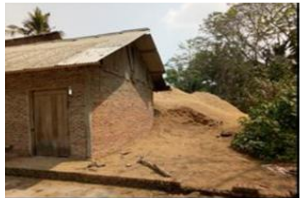
Gambar 1 Limbah sekam padi saat panen.

Buat gundukan/tumpukan sekam mengelilingi pipa pembakaran dimana pipa tersebut