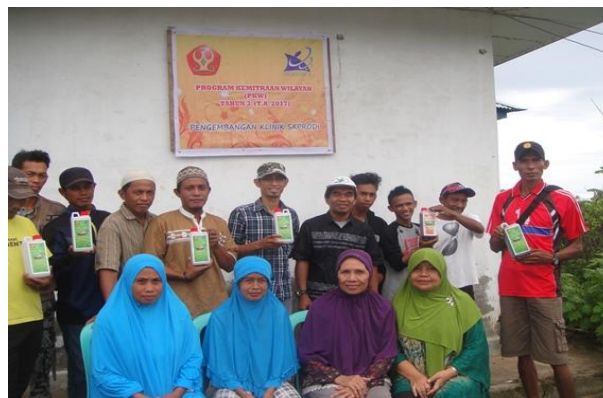
Gambar 5 Klinik saprodi PKW.

Pelaksanaan program kemitraan wilayah di Kecamatan Lakea Kabupaten Buol selama tiga tahun berturut-turut sejak tahun 2015–2017, beberapa produk saprodi pertanian dan peternakan berbahan baku sumber daya lokal telah dihasilkan oleh masyarakat sasaran program. Produk tersebut juga sudah dijual melalui klinik saprodi PKW. Agar dapat menjadi tambahan penghasilan bagi masyarakat maka produk