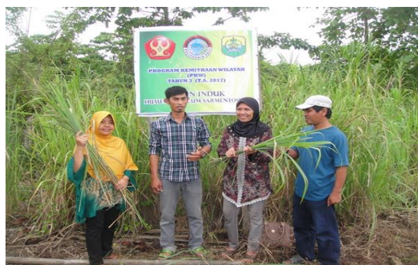
Gambar 6 Pengembangan kebun induk hijauan ternak.

rakitan teknologi hasil kajian dari tim pelaksana PKW tersebut perlu terus dikembangkan dan ditingkatkan jumlah dan mutu produknya, di antaranya dengan pengemasan dan pelabelan yang baik. Peran pemerintah daerah melalui instansi terkait sangat diperlukan dalam memberikan bimbingan dan pembinaan secara terus menerus kepada kelompok produktif masyarakat.