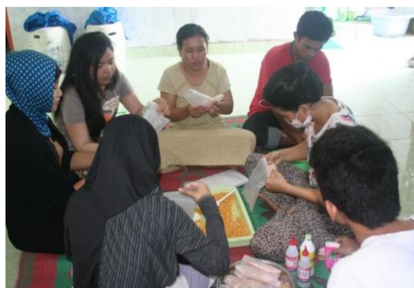
Gambar 4 Pengembangan bioinsektisida dan biofungisida.