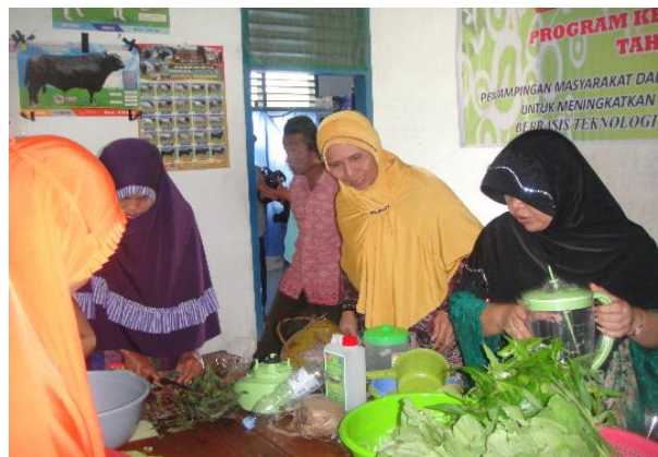
Gambar 3 Pengembangan POC.