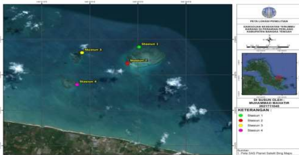
Gambar 1. Peta Lokasi Penelitian di Perairan Perlang, kecamatan Lubuk Besar, Kabupaten Bangka Tengah