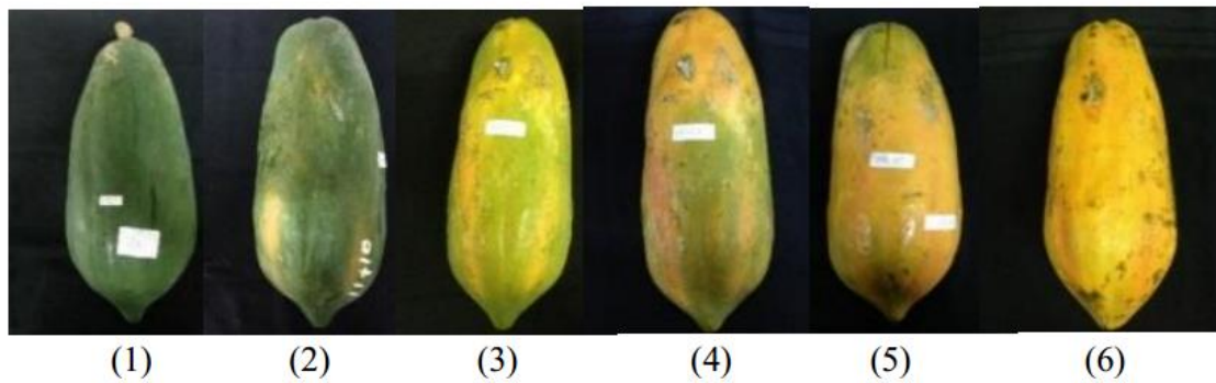
Gambar 2. Keragaan buah pepaya Sukma pada 6 skala. (1) Hijau, (2) Hujau dengan sedikit kuning, (3) Hijau kekuningan, (4) Kuning lebih banyak dari hijau, (5) Kuning dengan ujung sedikit hijau, (6) Kuning penuh

Berdasarkan nilai umur simpan yang diperoleh dengan satuan panas sebesar 2 100 °C merupakan kondisi yang baik untuk pemasaran produk yang waktu pemasarannya singkat dengan waktu transportasi kurang dari 4 hari. Hasil penelitian Putri (2016) pepaya Sukma di Pasir Kuda pada bulan Maret sampai Juli 2015 memiliki curah hujan yang tinggi sebesar 426.6 mm dan suhu 25.3 °C dengan umur simpan sebesar 9.00 HSP pada satuan panas 2 269.80 °C hari sedangkan pada satuan panas 1 967.03 °C hari memiliki umur simpan sebesar 12.7 HSP. Semakin tinggi nilai satuan panas yang digunakan, maka semakin singkat umur simpan buah pepaya Sukma. Hasil penelitian Fardilawati (2008) pepaya IPB 6C di Pasir Kuda pada bulan Nopember 2007 sampai Februari 2008 memiliki curah hujan sebesar 292.4-475.2 mm/bulan dengan umur simpan buah sebesar 3.48-3.85 HSP. Hasil penelitian Taris et al. (2014) pepaya Callina dengan satuan panas