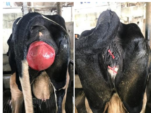
Gambar 1 Protrusi mukosa vagina (kiri), penjahitan simple interrupted pada labia vulva (kanan).

Anamnesa dan sinyalmen: Seekor sapi betina Friesien Holstein (FH) dalam kondisi laktasi kedua dengan produksi susu 10 liter/hari. Sapi baru melahirkan seminggu sebelumnya dan masih sapi sering merejan. Protrusi mukosa vagina ditemukan dalam kondisi menggantung di vulva (Gambar 1). Peternak melaporkan ke koperasi dan meminta petugas kesehatan hewan untuk menangani kasus tersebut.