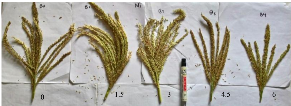
Gambar 1. Variasi morfologi tassel berdasarkan dosis boron (kg ha -1 )

Pemupukan NPK 600 kg ha -1 bersama dengan boron 3 kg ha -1 meningkatkan viabilitas serbuk sari tetua jantan jagung hibrida Bima 3 dari 89.6% menjadi 99.3% menggunakan pewarna I 2 KI (Handayani, 2014). Proses produksi benih jagung memerlukan serbuk sari dengan viabilitas tinggi